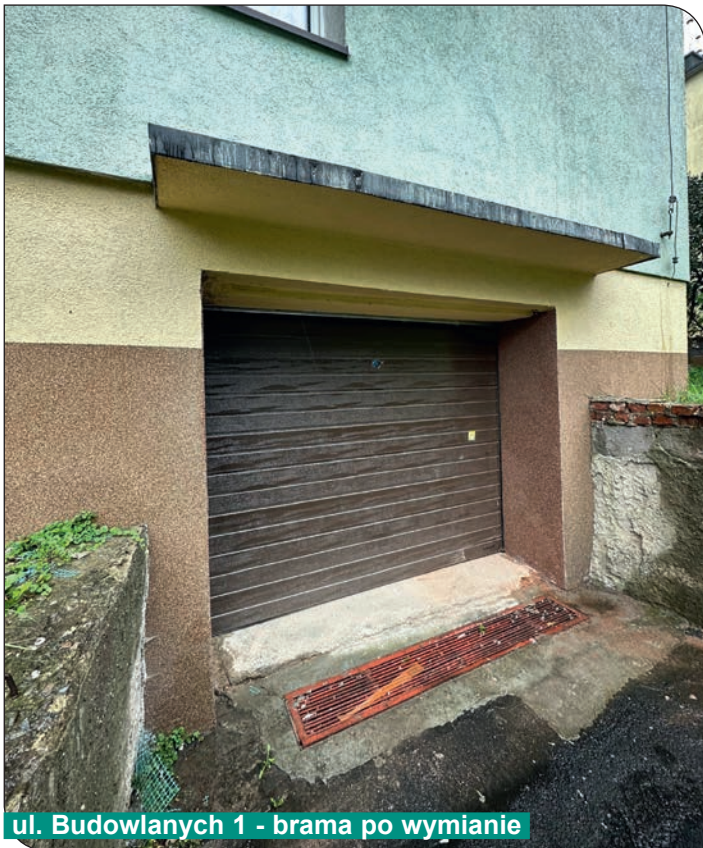
ul. Budowlanych 1 - brama po wymianie