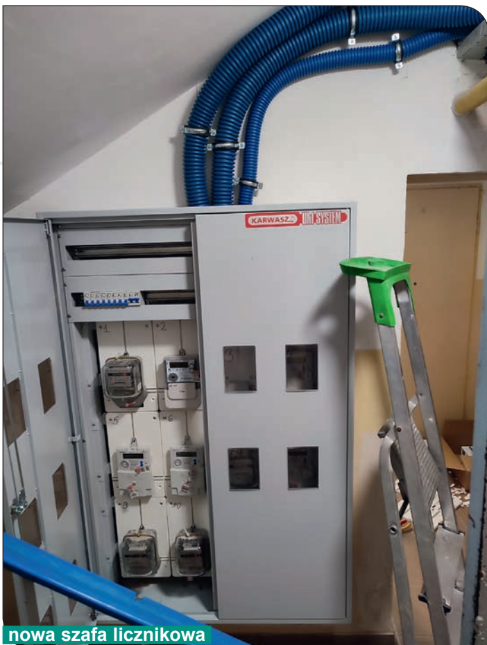
nowa szafa licznikowa