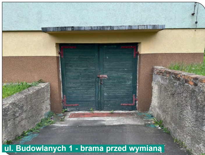
ul. Budowlanych 1 - brama przed wymianą

matycznie na pilota co znacznie ułatwia korzystanie z garaży. W przyszłości planowana jest sukcesywna wymiana bram garażowych na pozostałych budynkach Spółdzielni Mieszkaniowej.