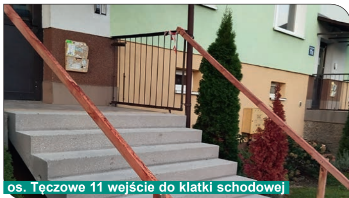
os. Tęczowe 11 wejście do klatki schodowej

czone biegi schodowe na nowe prefabrykowane. W następnej kolejności zostaną wyremontowane spoczniki na wejściach do klatek oraz zamontowane nowe poręcze.